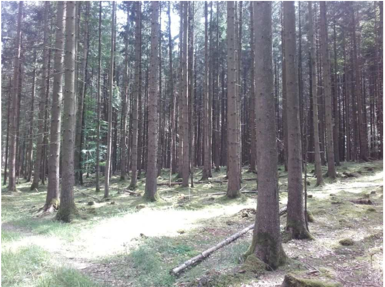
Abb. 1 Unterer Grundwald: fast reines Fichtenbaumholz